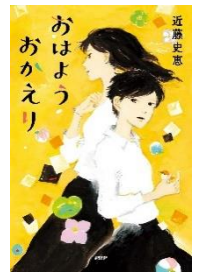
『おはようおかえり』 近藤 史恵 // 著、 PHP 研究所