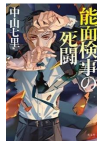
『能面検事の死闘』 中山 七里 // 著、 光文社