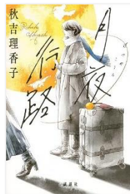
『月夜行路』 秋吉 理香子 // 著、 講談社